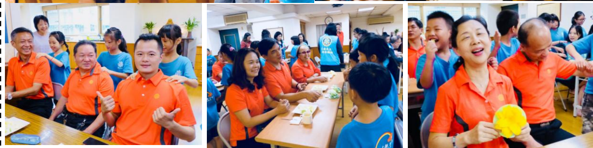
新北城星扶輪社蒞臨訪問