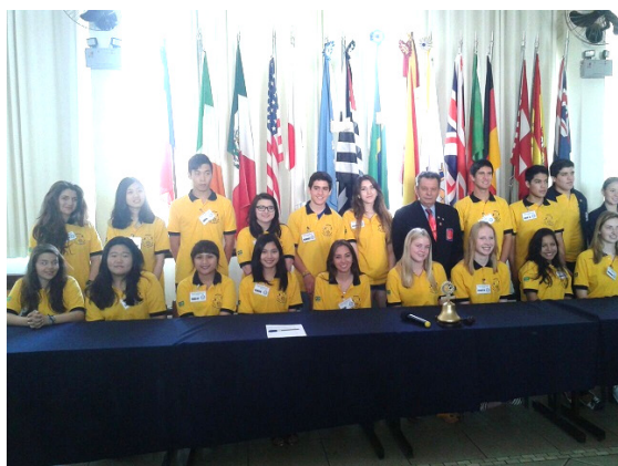
D4620 八月例會所有交換學生