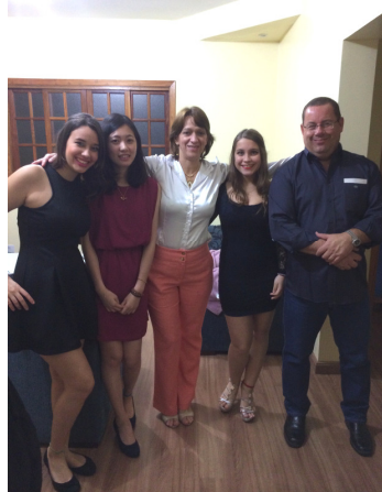
第一次參加派對，很有趣也很瘋狂