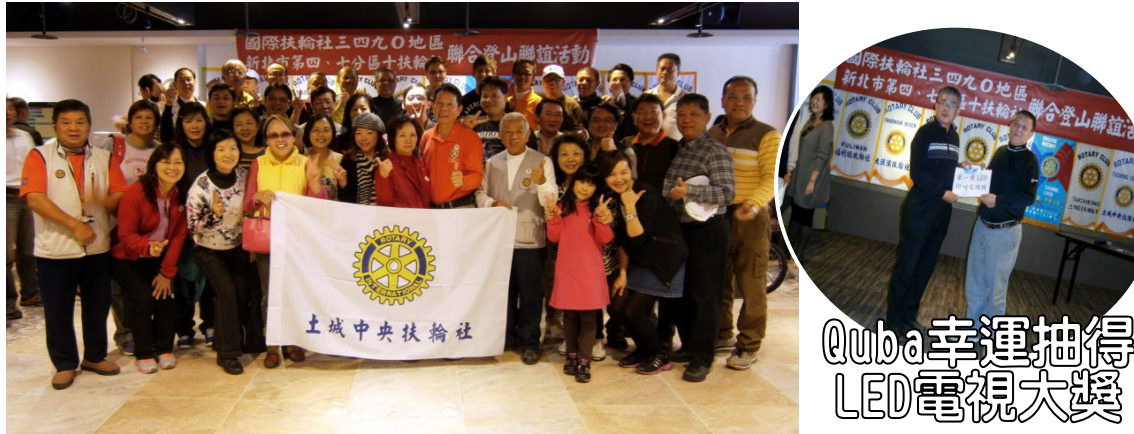
Quba幸運抽得LED電視大獎