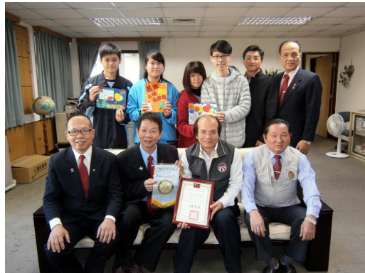
社區服務-捐贈啟聰學校閱讀寫作比賽用品 102年12月3日