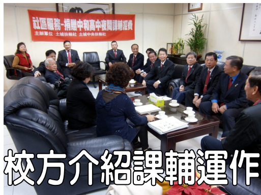
校方介紹課輔運作