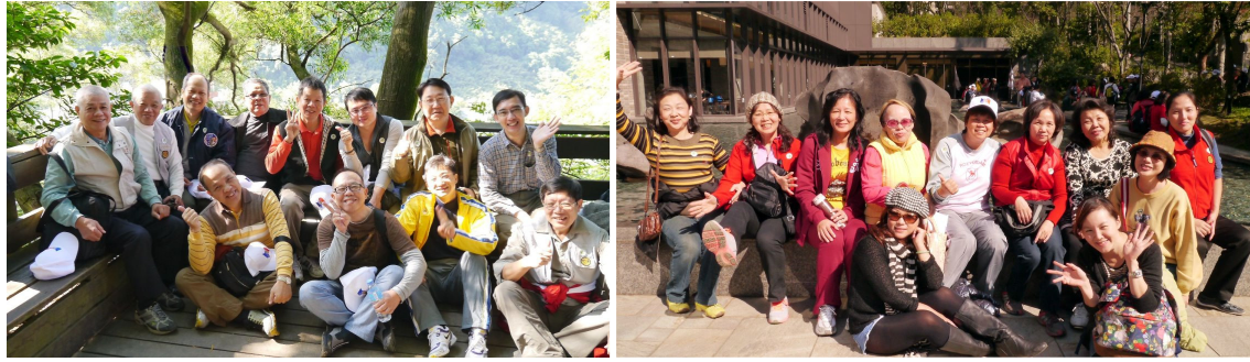
四七分區聯合登山活動花絮 102年11月30日 大板根森林園區