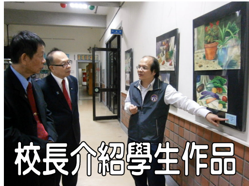
校長介紹學生作品