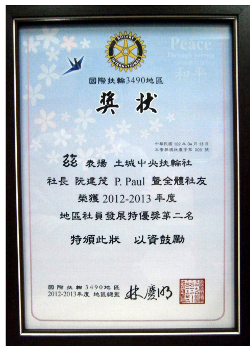
地區社員發展特優第二名