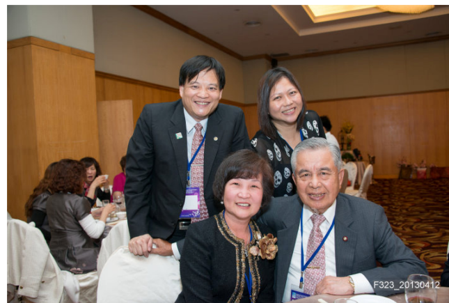
巨額捐獻人及保羅哈里斯之友晚宴