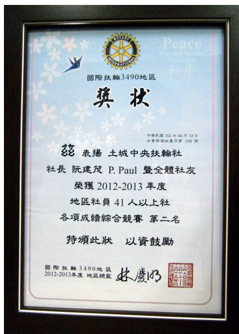
社員人數 41 人以上組 各項成績綜合競賽第二名