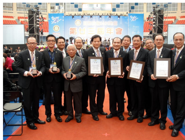
社友年會紀念大合照