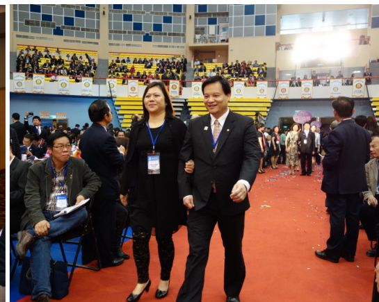
社長伉儷進場儀式