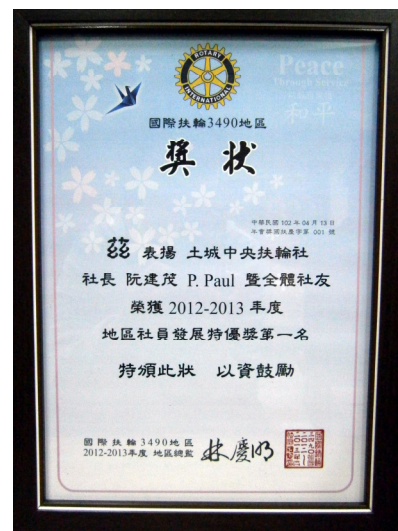
地區社員發展特優獎 第一名