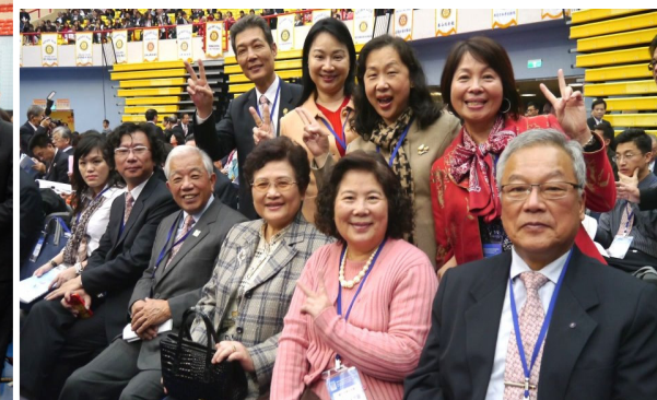
社友與寶眷參加年會合照