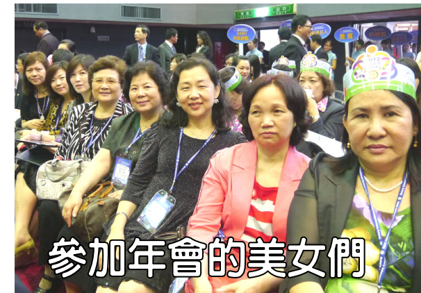
參加年會的美女們