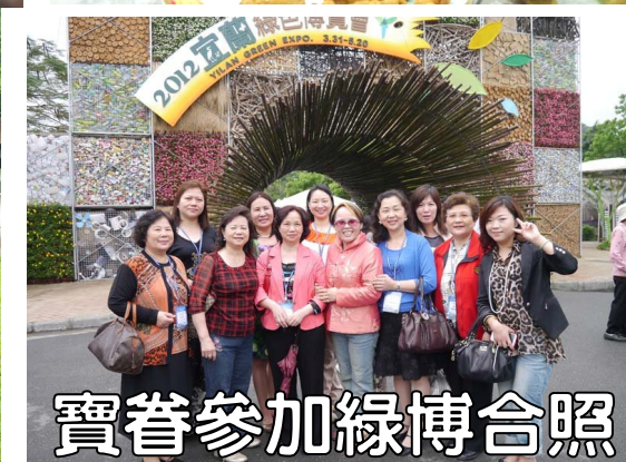
寶眷參加綠博合照