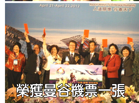
榮獲曼谷機票一張