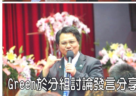
Green 於分組討論發言分享