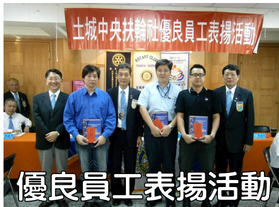
優良員工表揚活動