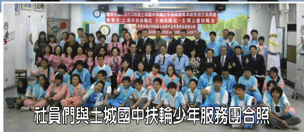
社員們與土城國中扶輪少年服務團合照