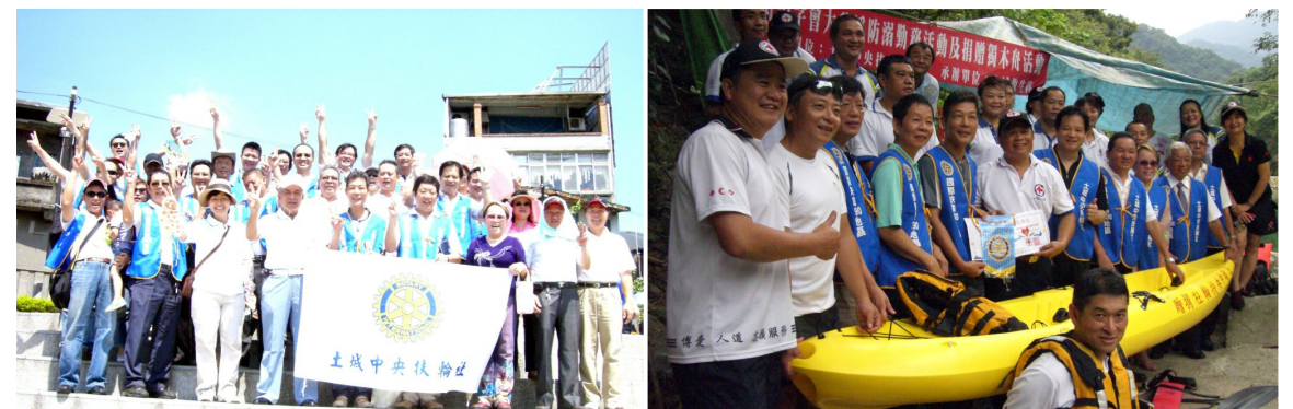
關懷地球 世界清潔日活動 捐贈紅十字會土城分會獨木舟