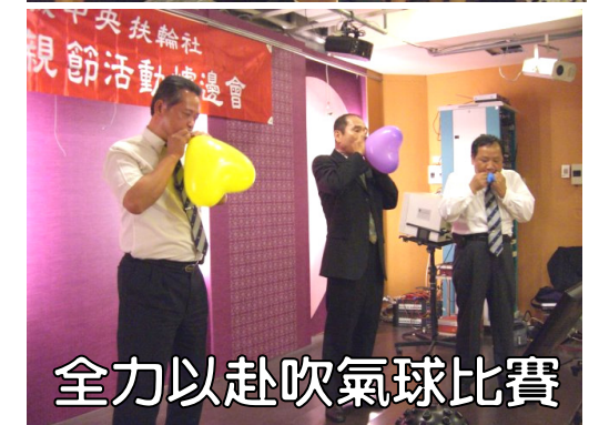
全力以赴吹氣球比賽