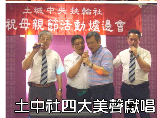
土中社四大美聲獻唱