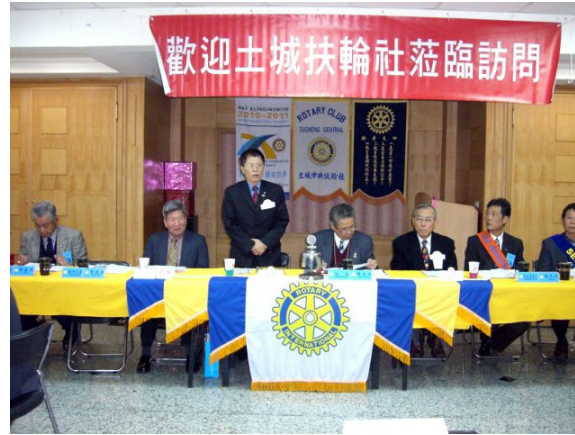
活動：土城扶輪社蒞臨訪問 日期：100年1月6日

(歷屆結餘)$631,673(含行政助理離職準備金$46,000元) + (12月餘)$155,474=787,147元 甲存:$93,264元(應付款$0) 乙存:$643,883元(已收未兌現票據:$68,400) 零用金:$50,000元 社長： 批書： 會計： 製表人：