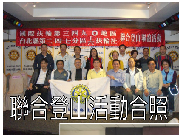
聯合登山活動合照