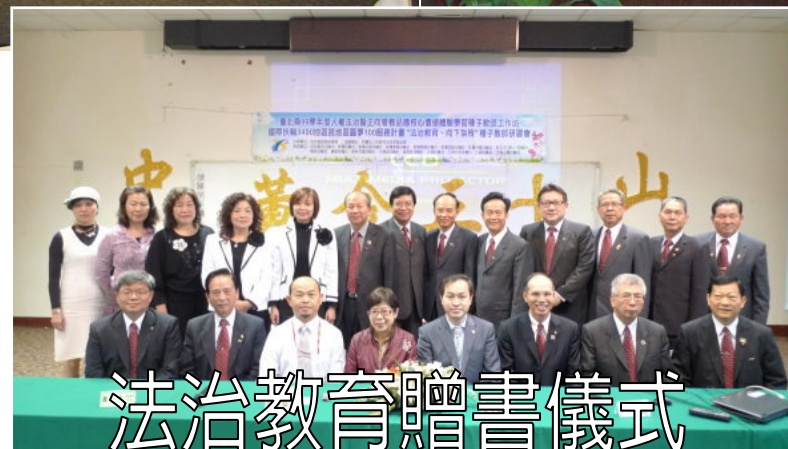
法治教育贈書儀式