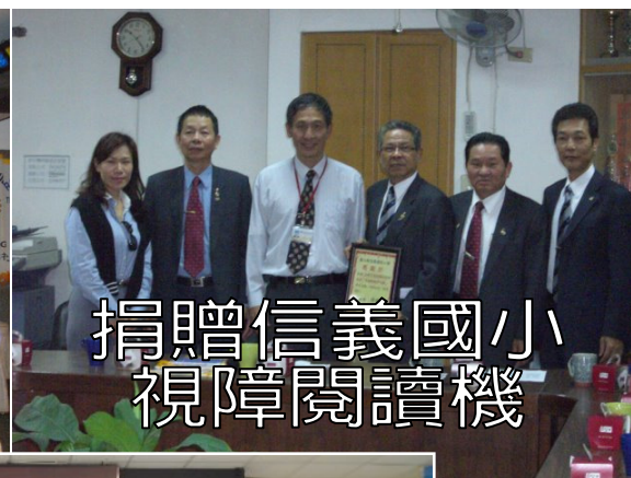
捐贈信義國小視障閱讀機